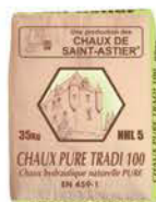
CHAUX PURE TRADI 100® NHL 5 (35 kg)