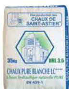
CHAUX PURE BLANCHE LC****® NHL 3,5 (35 kg)

Il est possible de réaliser aussi des Bétons de Chaux avec de la bille d'argile expansée. Nous consulter.