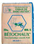
BÉTOCHAUX® NHL 5 CHAUX SPÉCIALE BÉTON (30 kg)

☛ Consulter la fiche produit spéciale BÉTOCHAUX®